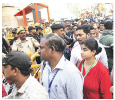
सर्वेक्षण दल में शामिल लोग

प्रधान न्यायाधीश डी वाई चंद्रचूड़, न्यायमूर्ति जे बी पारदीवाला और न्यायमूर्ति मनोज मिश्रा के पीठ ने कहा, 'हम याचिकाकर्ताओं को संविधान के अनुच्छेद-227 के तहत अपने अधिकार क्षेत्र का प्रयोग करते हुए और उचित सुनवाई के लिए वाराणसी के विद्वान जिला न्यायाधीश के आदेश को चुनौती देने के वास्ते उच्च न्यायालय का रुख करने की अनुमति देते हैं।' उसने कहा, 'इस तथ्य को ध्यान में रखते हुए कि जिला अदालत का आदेश 21 जुलाई को शाम 4.30 बजे पारित किया गया था और एएसआई सर्वेक्षण सोमवार को शुरू किया गया, हमारी राय है कि याचिकाकर्ताओं को उचित राहत देने के अनुरोध को लेकर उच्च न्यायालय का दरवाजा खटखटाने के लिए कुछ समय दिया जाना चाहिए।'