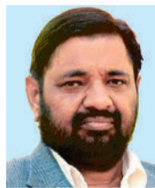
Sh. Kaushal Kishore Hon'ble Minister of State Ministry of Housing and Urban Affairs Government of India